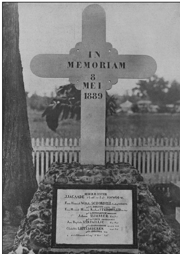
Figuur 94: graf 1 e luitenant Gaade (en anderen) te Edi 906